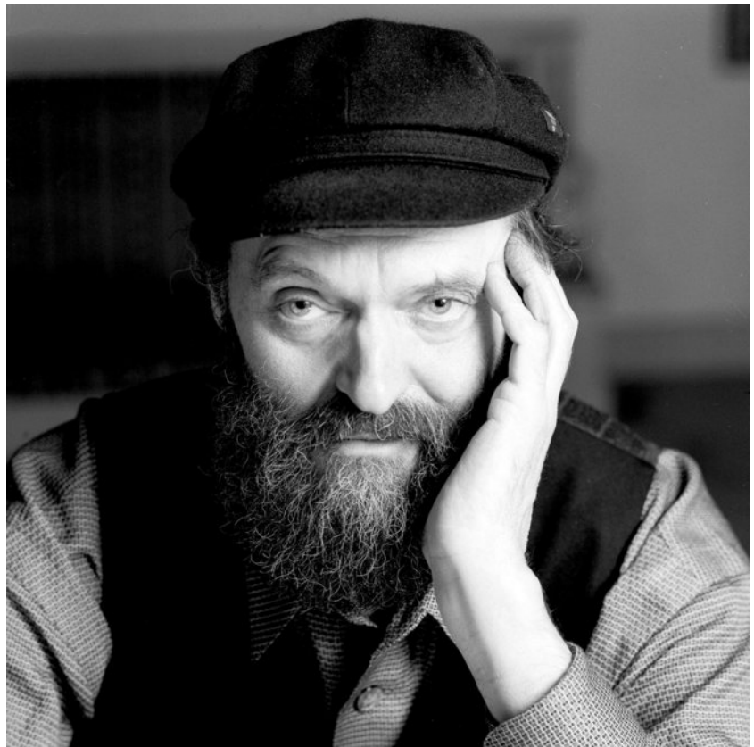
Arvo Pärt (1935)