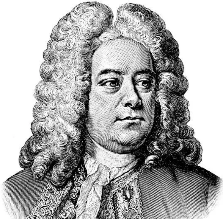
George Frideric Handel (1685-1759)