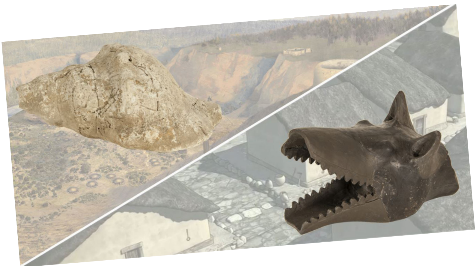
Trompa sobre Charonia Nodífera (Caracola), Los Millares y Trompa numantina en forma de cabeza de cánido. Museo Arqueológico Nacional