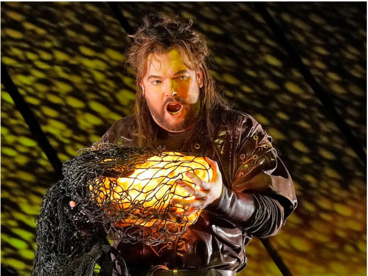
Das Rheingold de Wagner.