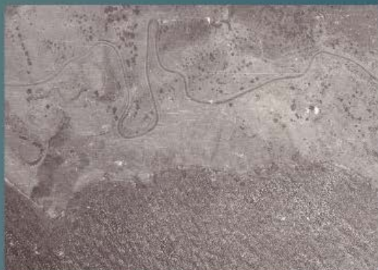
Fotografía aérea

A todo ello se unen los sufrimientos de uno de los primeros grandes éxodos de población civil indefensa, a causa de la guerra, previos a los desplazamientos de población que alcan-