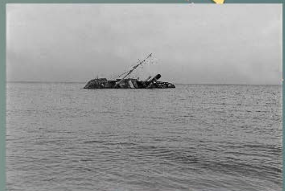
ICAS-SAHP, FOTOTECA se4_g_24-042

tanto, dada su posición defensiva ante la peligrosa amenaza rebelde sobre la capital española. Queipo cambió sus planes sólo cuando pudo disponer de las fuerzas expedicionarias italianas recién llegadas a España. El fracaso en Madrid implicó que Franco pensara en Málaga como escenario del estreno de las columnas motorizadas, bien equipadas aunque de tropas no muy expertas, que mandaba el coronel Roatta en España.