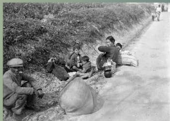
ICAS-SAHP, FOTOTECA. se4_g_12-016

La materia prima con la que se construyen los cimientos de cualquier investigación histórica son los documentos, sea cual sea el soporte en el que estos se plasmen. El hecho de este éxodo de miles de personas por la carretera de Almería no es una excepción, pero el que huye de quienes piensa que podrían ser sus verdugos no deja testimonio escrito de por qué parte y hacia donde va. Asimismo, quienes perpetran crímenes, amparados por una situación de guerra, procuran no documentar esos hechos. No obstante, cada orden política, cada movimiento de tropas, cada herido atendido en