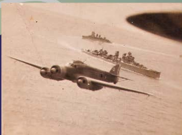
Avión trimotor con el Crucero Canarias al fondo

A principios de 1937 los frentes de Málaga estaban estabilizados, tras la conquista por los rebeldes en agosto de Antequera, Archidona y Loja, pero la situación de la provincia no dejaba de ser comprometida dada su extensión y el progresivo control rebelde del mar y el aire. Málaga era, además, el gran objetivo del impaciente general Queipo de Llano para completar la conquista de Andalucía. Para Franco, en cambio, era un frente secundario, empeñado en la conquista de Madrid para terminar pronto la guerra. Para la República ocurría otro